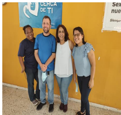
Nuevo consejo local de la Fraternidad de República Dominicana.